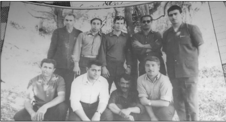
Şakillərdə: 50 il əvvəl Şükürbəyli kənd orta məktəbinin şən, qayğısız məktəb illərindən ayrı-ayrı anlar